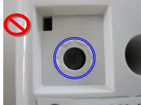
las copias no utilizan flecha indicadora