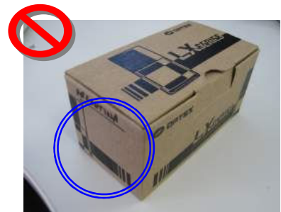
sin etiqueta en el cuadro