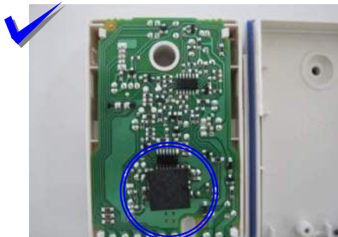
OPTEX utiliza una esponja negra protectora del circuito