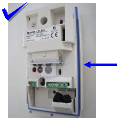
OPTEx utiliza anillo Azul de sellado