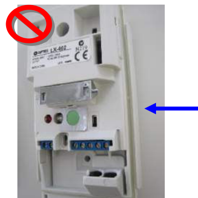
Copias no utilizan anillos de sellado