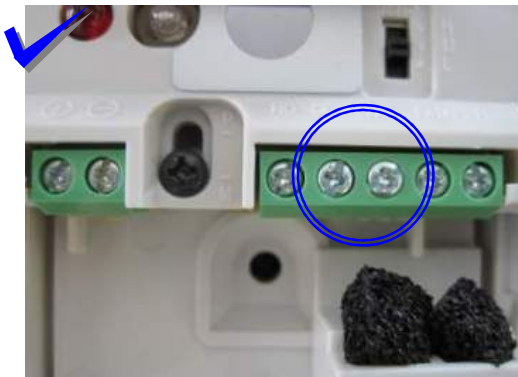
OPTEX utiliza terminales denominados como (+) y (-).