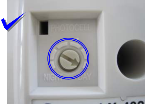
OPTEX utiliza la cabeza del tornillo con una flecha