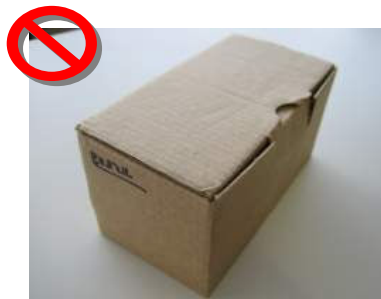
No imprime en caja